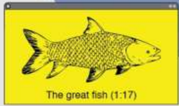
The great fish (1:17)