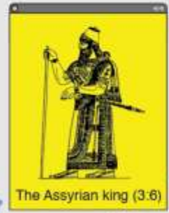
The Assyrian king (3:6)