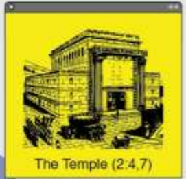
The Temple (2:4,7)